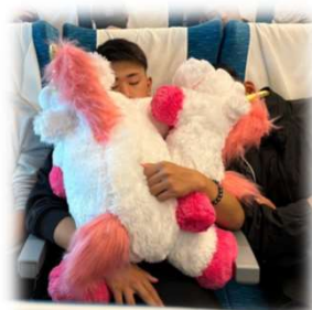
おみやげ たくさん買ったよ