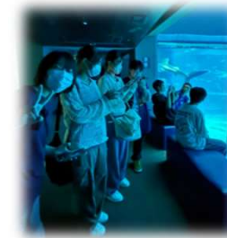
ジンバイザメ 発見!?