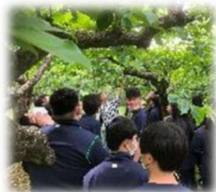
生徒たちはメモを取りながら熱心に話を聞いていました！