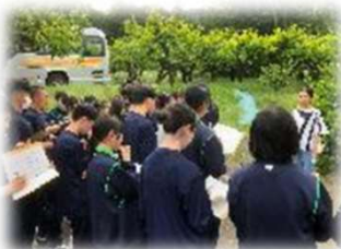
果樹園取材の様子